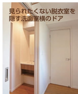
見られたくない脱衣室を 隠す洗面室横のドア