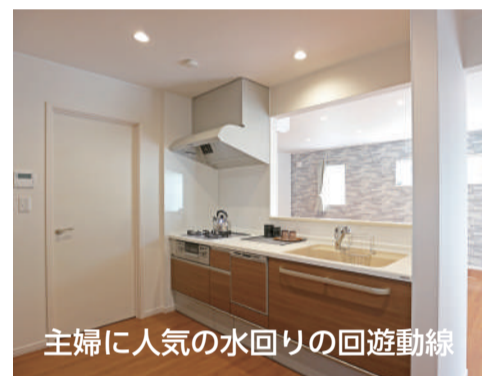
主婦に人気の水回りの回遊動線