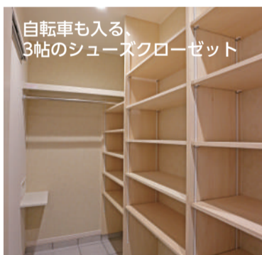
自転車も入る 3帖のシューズクローゼット