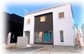
モデルハウス外観