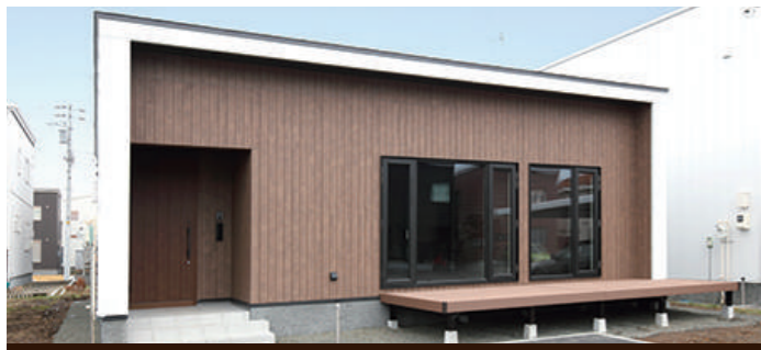
飽きが来ない シンプルな外観

DATE 1.12 (SAT) . 13 (SUN) . 14 (MON) ⌚ 10:00~17:00