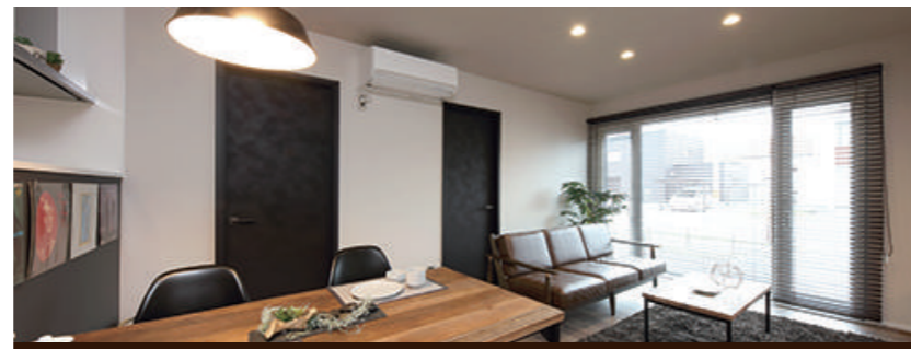
スクエアの室内はインテリア次第で自由なスタイルに

3つの「WARM」が生み出す新しい「HOKKAIDO STANDARD HOUSE」