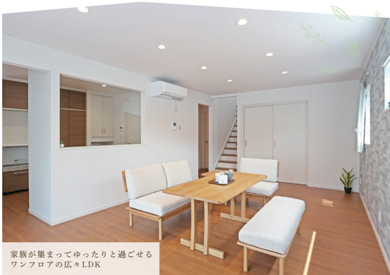
家族が集まってゆったりと過ごせる ワンフロアの広々LDK