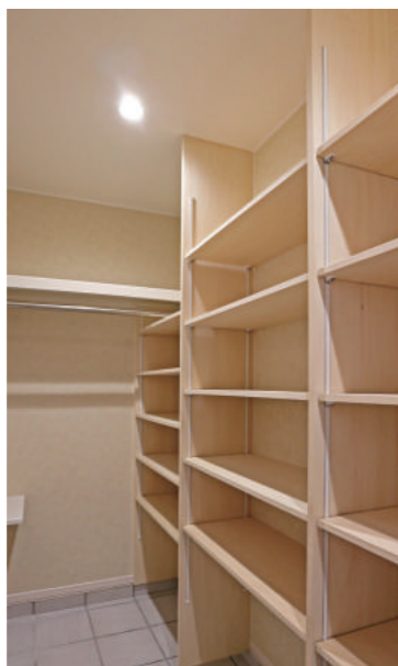
自転車も入る 3帖の広々シューズクローゼット