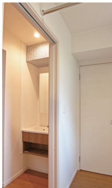
プライバシーを考慮して設計された 脱衣室を隠す洗面室横のドア