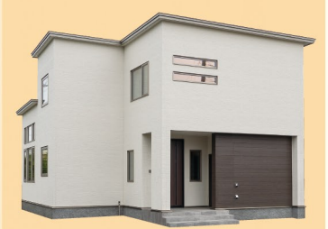
アイビーホーム株式会社