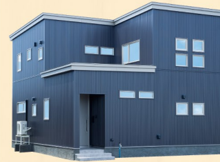
K 株式会社 協栄ハウス