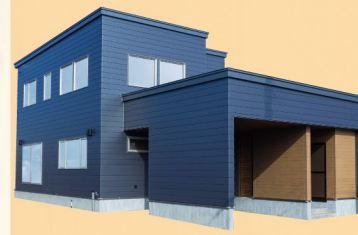
KH 株式会社 建成ホーム(株) 苫小牧支店