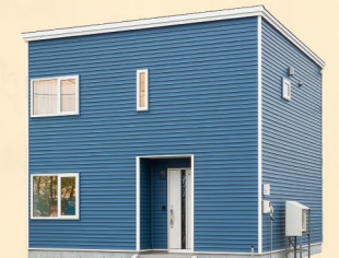
神出設計 ecoa House エコアハウス