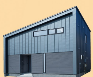
株式会社 菅原工務店 SUGAWARA