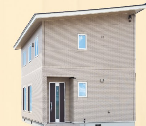
家は、性能。 一条工務店