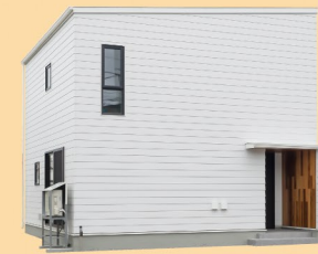
DAISHIN KIMURA 大鎮キムラ建設 株式会社