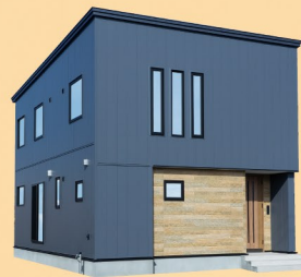
株式会社 渡辺工務店 watanabe ko-muten