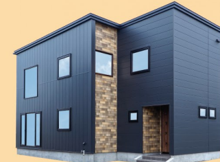
神出設計 ecoa House エコアハウス