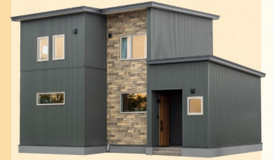
LOGOS HOME 株式会社 ロゴスホーム