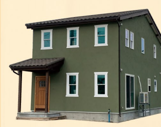
ソレイユの家 DAISHIN KIMURA 大鎮キムラ建設 株式会社